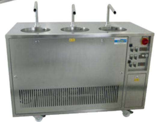
LCM Triple Temper