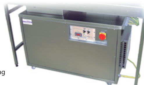
LCM Bandsteuerung und Kühlaggregat in separatem Wagen als Standardausführung