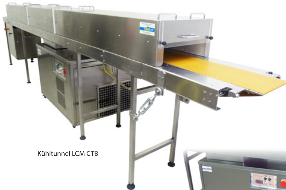
Kühltunnel LCM CTB

Aus servicetechnischen Gründen befindet sich das Kühlsystem mit der austauschbaren, elektronischen Steuerung in der separaten Kühlstation.