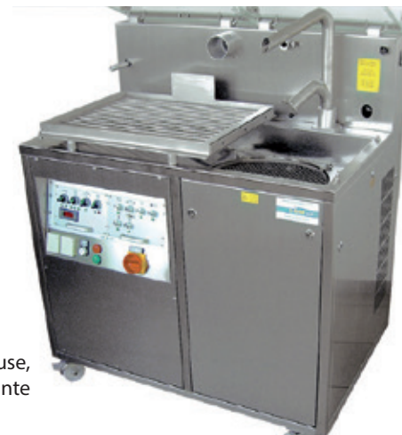
comme mouleuse, ici avec table vibrante chauffante