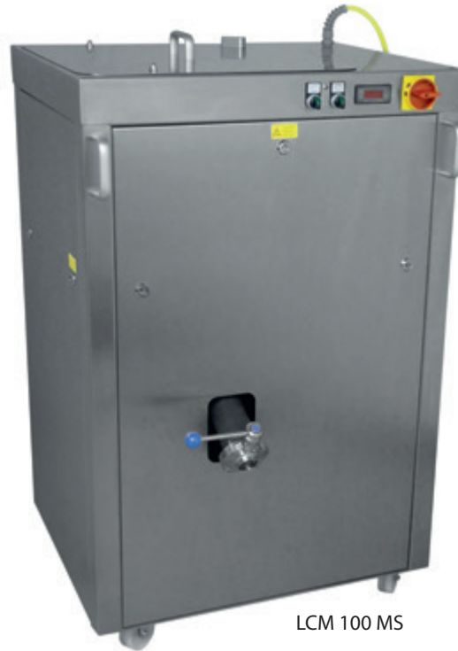
LCM 100 MS

Die hochwertige Isolierung der Tanks in Verbindung mit der Abschaltung der Heizkreise bei geringerem Füllstand hält den Stromverbrauch gering.